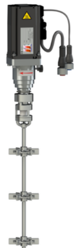
Modèle AGM-T CERAM